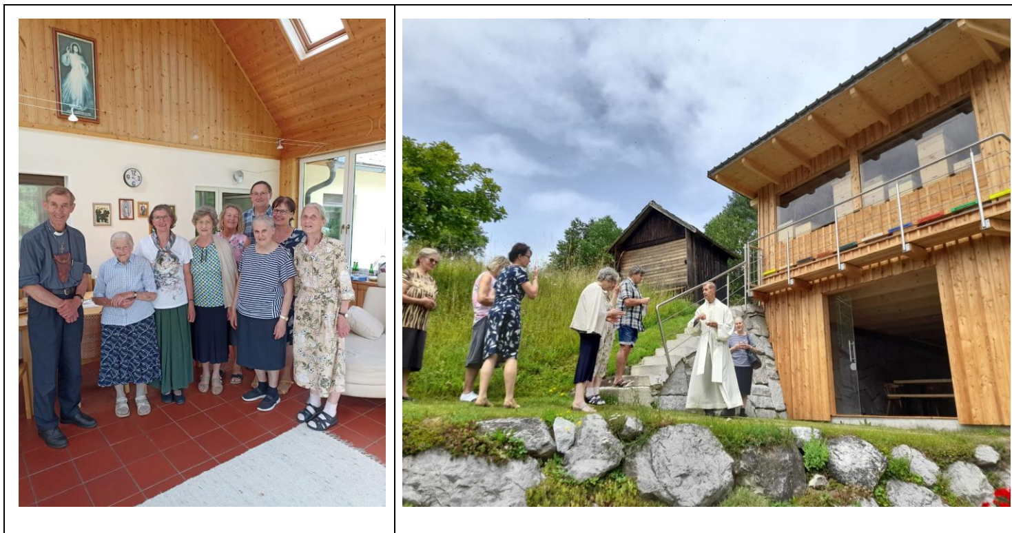
Foto di gruppo e Benedizione della nuova capanna delle api